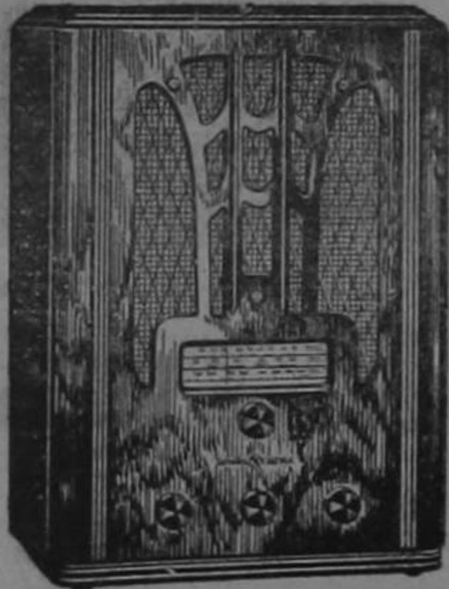
RADIO G. E. MODELO E-81

Es el sello distintivo de los nuevos radios General Electric de Focused Tone