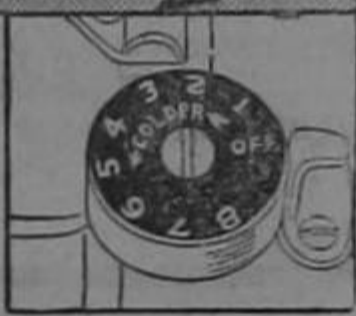
Temperature regulator speeds freezing